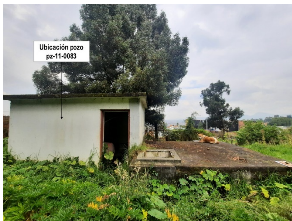
Foto No. 3. Ubicación pozo pz-11-0083