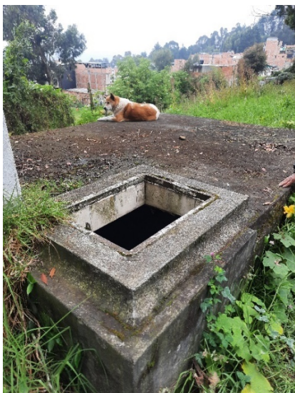
Foto No. 6 Tanque de almacenamiento