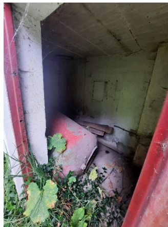
Foto No. 4 Vista interna cuarto de maquinas