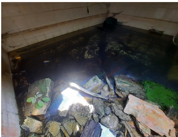
Foto No. 7 Vista interna tanque de almacenamiento