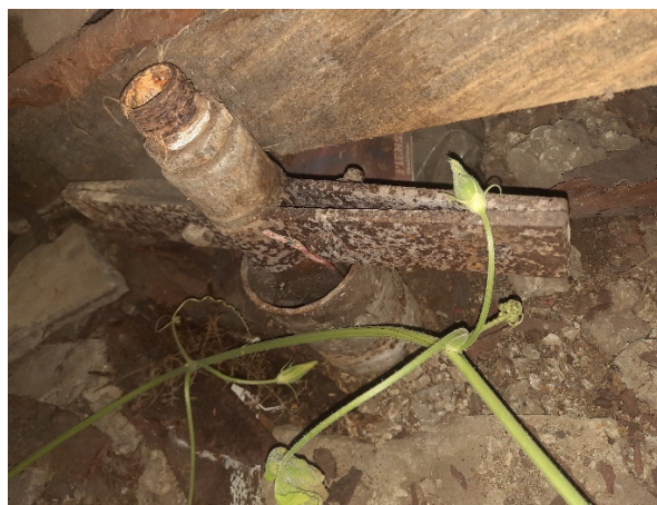
Foto No. 5 Condiciones actuales pozo pz-11-0083

12:47:22 4°43'27.91921"N - 74°5'0.62793"W 129f-6 Carrera 85 Suba Bogotá